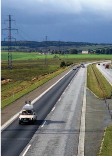
Er den grænseløse by bæredygtig?