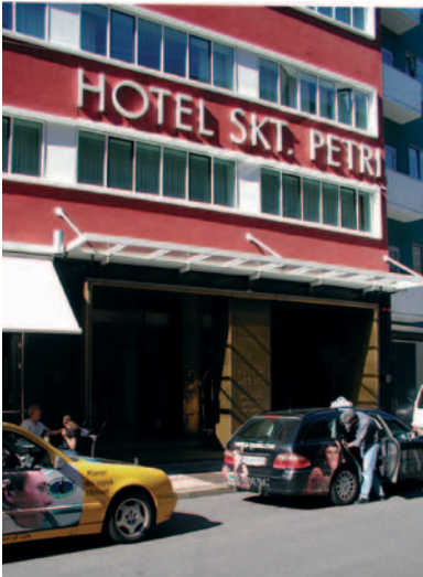
Hvad skal vi leve af i den grænseløse by?

Globaliseringen betyder bl.a. at erhvervsstrukturen i Danmark ændrer sig fra råstof- til videnbaseret produktion. Den fortsatte velstandsstigning betyder, at der udvikles nye livsstile og boligformer. Det stiller nye krav til byudvikling, til infrastruktur, og til byen som ramme for de medarbejdere, der indgår i den videnbaserede produktion og de kreative erhverv.