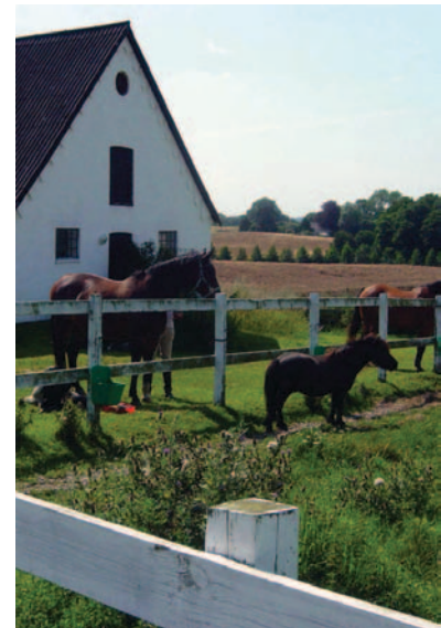
Det gode liv?

I dette tema undersøges det, dels hvilke ønsker og præferencer der spiller en rolle for denne udvikling, dels hvad den grænseløse by betyder for hverdagsliv og boligmiljø.